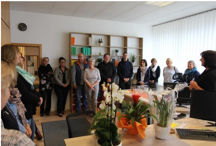
Einweihung der neuen Räume am 4.11.2016